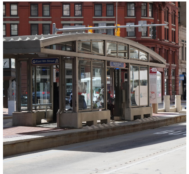
Health Line BRT, Cleveland, OH

Txoj kev ntsuas ib puag ncig yuav siv cov kab lim kev cai nom tswv ib txwm siv hauv lub xeev thiab teb chaws no thiaj li yuav muaj ib daim ntawv los hais qhia txog vim li cas txoj hawjlwm no yuav tsum saib xyuas kom ua tau, hais qhia txog lwm lub tswv yim uas twb muab los xam tas tib si ua ntej lawm thiab, txoj hawjlwm no yuav los cuam tshuam tej nplooj xyoob nplooj ntoos ntuj tsim thiab neeg tsim tau ib puag ncig li cas, thiab yuav ua li cas thiaj li zam tau.