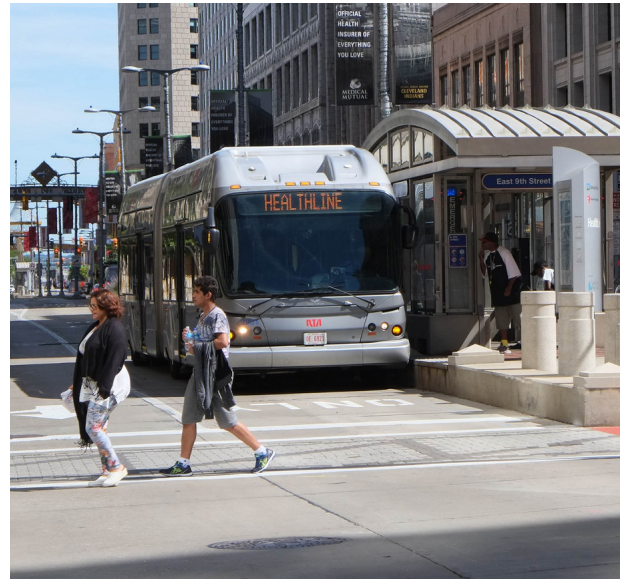
Health Line BRT, Cleveland, OH